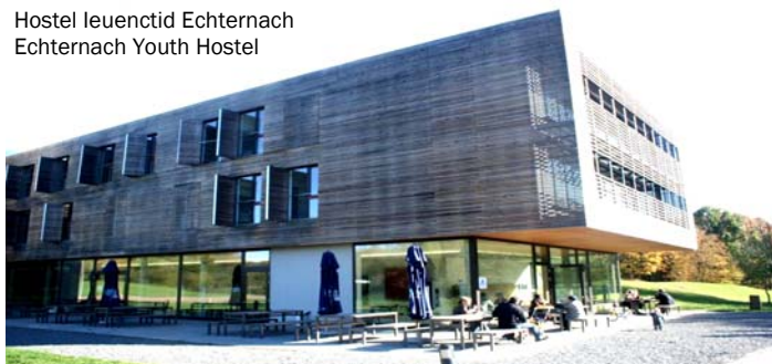
Hostel Ieuencid Echternach Echternach Youth Hostel